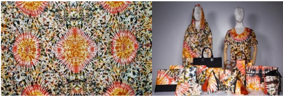
ภาพที่ 1 ลวดลายผ้าชะเลียงร้อนทอง และผลิตภัณฑ์ของที่ระลึกจากลวดลายผ้าชะเลียงร้อน